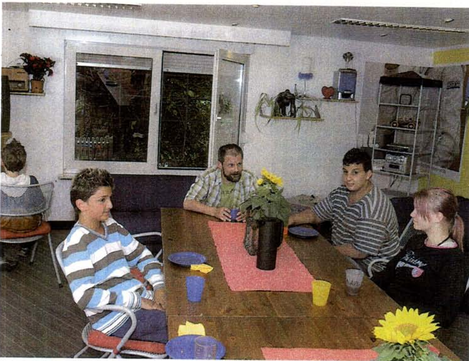
Die Einrichtung der Räume der Tagesgruppe des Gerhard-Tersteegen-Instituts erinnern an ein Jugendzentrum. Gemeinsam mit ihren Betreuern lernen die Jugendlichen, sich hier durch eine sinnvolle Tagesstruktur in Schule und Alltag zu stabilisieren.

me Aktivitäten, um damit die Grundlage für eine sinnvolle Tagesstruktur zu schaffen.