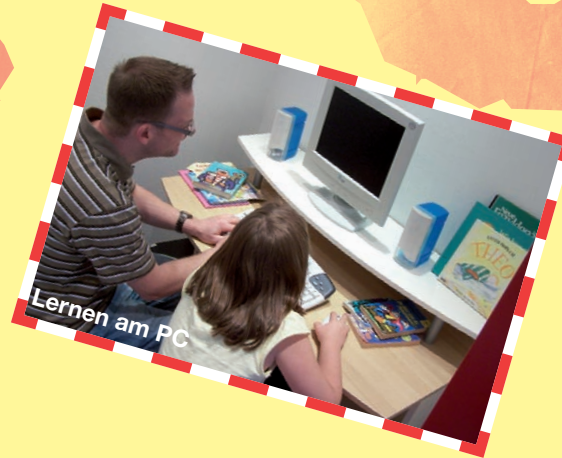
Lernen am PC